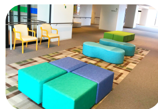
< 2階ロビー >