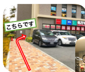
< 建物内来客用駐輪場 >