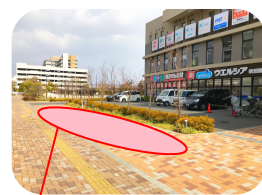
< 赤枠部分は駐輪可能です >