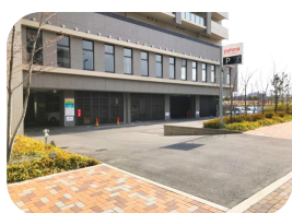
< 当施設有料駐車場 >