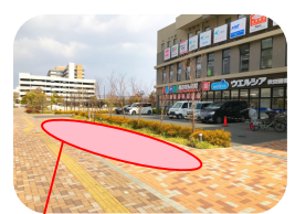
<赤枠部分は駐輪可能です>