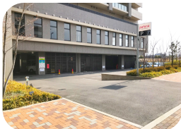
<当施設有料駐車場>