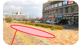
<赤枠部分は駐輪可能です>