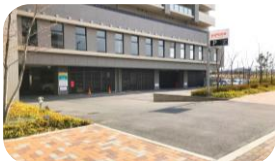
<当施設有料駐車場>