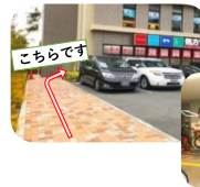
<建物内来客用駐輪場>