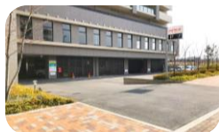
< 当施設有料駐車場 >