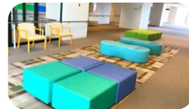
< 2階ロビー >