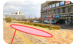
< 赤枠部分は駐輪可能です >