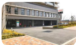
< 当施設有料駐車場 >