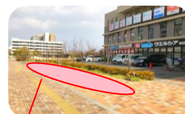
< 赤枠部分は駐輪可能です >