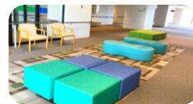
< 2階ロビー >